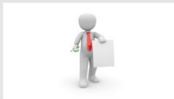
Operaciones de Crédito