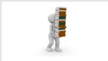
Normativa y guías