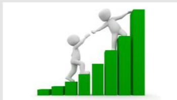
Abonos y Subvenciones