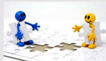
Cuenta de repartimientos